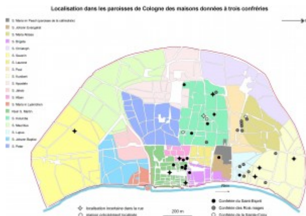
Illustration 2 : Localisation dans les paroisses de Cologne des maisons données à trois confréries.

l'organisation paroissiale était redoublée par la structuration seigneuriale (comme à Paris) ou une organisation municipale (comme à Cologne), et si l'on admet que la sociogenèse des « communautés d'installés » devait être indissolublement spirituelle et corporelle, alors il faut tenter de comprendre comment cette situation d'hétérogénéité paroissiale a été dépassée.