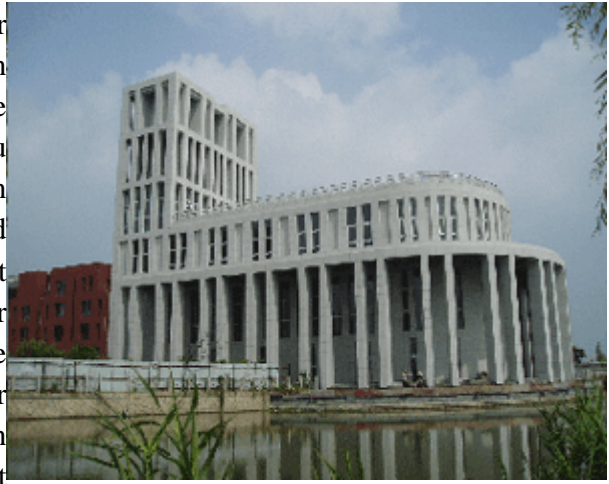
Abb.9: Die Kirche von Anting (GMP, im Bau).

In Anting Neustadt wurde das Prinzip der inklusiven Stadt naiv in einen exkludierenden kulturellen Kontext implantiert. So strauchelt die Inklusion über die Exklusion. Man hat sich zu wenig Rechenschaft darüber abgelegt, dass in China die Wohnsiedlung der Familie und Gemeinschaft gehört, der Handel bzw. Markt jedoch der offenen Stadt. Die Akzeptanz dieser Doppelstruktur wäre die Voraussetzung für eine gelingende Transposition räumlicher Begabungen aus Deutschland nach China. Den urbanen Code Chinas verstehen und ernst nehmen bedeutet nämlich, dass man sich aktiv gestaltend auf die Produktion räumlicher Hybride einlässt – anstatt nachzubessern. Doch dazu fehlte es offenbar an einem elaborierten Verständnis für den urbanen Code Chinas.