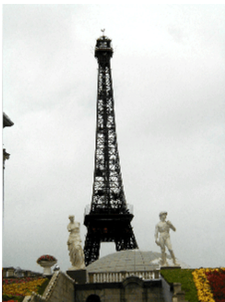
Abb. 22: Hyperreale Assemblage von Venus, David und Eiffelturm in Shenzhen.

Anders das 'Fenster der Welt' in Shenzhen. Hier geht es nicht um Traumwelten; es werden keine Fantasiegebilde oder bauliche Übertreibungen angeboten, sondern gleichsam dreidimensionale Fotografien prominenter Bauwerke aus nahezu allen geschichtlichen Epochen und von jedem Kontinent (außer der Antarktis) ausgestellt – das Ganze mit einer Garnierung aus Fontäne (100 m Höhe!), Matterhorn- und Fujiama-Imitaten und, nicht zu vergessen, 'Gottes Hand'. Zwar geht es auch hier um Emotionen, jedoch in abgewogener Form. Das Gegengewicht bilden Inhalte, die insbesondere an wissbegierige Kinder und Erwachsene vermittelt werden. Für Schulklassen ist 'Window of the World' ein beliebtes Ziel.