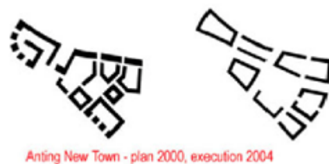
Fig. 2: Anting vorher – Anting nachher.

Das kulturelle Gewicht des Dualismus von abgeschlossener und aufgeschlossener Stadt bzw. der urbanen Dialektik von Exklusion und Inklusion, scheint den Planungen von vornherein äußerlich gewesen zu sein. Anting wurde als offene, funktionsintegrierte deutsche Stadt geplant. In der Mischung von Wohnfunktion und Handelsfunktion im offenen Stadtraum sollte offenbar das Ideal eines deutschen Lebensgefühls zum Ausdruck gebracht werden. Geschlossene Nachbarschaften waren nicht vorgesehen. Der breite Wassergraben, welcher die ganze Stadt umgibt, lässt sich jedoch als