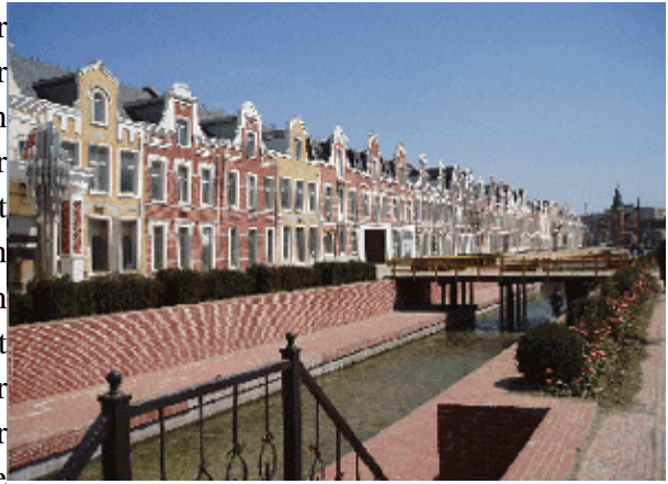
Abb. 21: Fiktionale Grachtenhäuser in Shenyang.

In Neu Amsterdam ist nichts eindeutig. Der Haupteingang gibt sich wie das Tor zu einer Nachbarschaft. Doch andererseits gibt sich dieses Quartier als thematische Stadt im Stile der Shanghaier Neustädte. Der ganze Stadtraum ist als geschlossener Raum konzipiert. Die als offen inszenierten Bereiche sind somit im Prinzip auch geschlossen. Andererseits gliedert sich die Stadt in mehrere Nachbarschaften, darunter Villenquartiere, multiple Quartiere (nach Art der stufenförmigen Bebauung), Hochhaus-Quartiere und, nicht zu vergessen, in den fiktionalen Stadtkörper