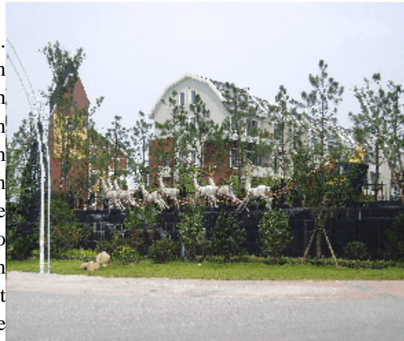
Abb.16: ‘Branding’ in Luodian durch Mansardgiebel-Dächer, Rentiere etc.

Um eine Kopie der schwedischen bzw. skandinavischen Stadt zu bewerkstelligen, ist man weder den deutschen, noch dem kopiertechnisch anspruchsvollen britischen Weg gegangen. Man hat sozusagen frei gestaltete, jedoch idealtypisch gemeinte nordische Häuser in Musterblöcken arrangiert. Die Produktion von Blöcken bereitete dabei überhaupt keine Probleme, da sowieso niemand in den Gebäuden des offenen Stadtbereichs jemals wohnen wird. Jeder Block ist an irgend einer passenden oder unpassenden Seite aufgebrochen. Durch ein symbolisches hölzernes Tor kann man den Innenhof betreten – und steht dann auf einer versiegelten Fläche in die meist runde oder ovale Grünflächen eingelassen sind.