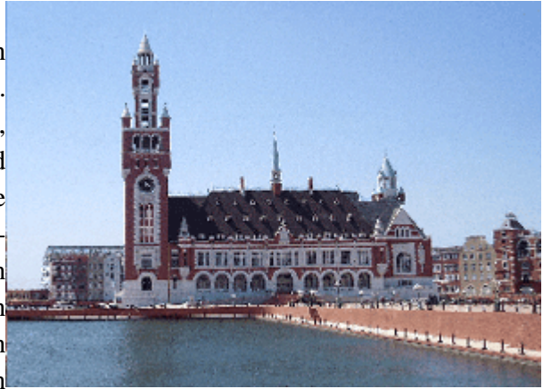
Abb.19: Rathauskopie in Shenyang.

Wenn man nach Neu Amsterdam kommt, dann geht man durch große unbewachte Torbögen. Die Fenster der meisten Gebäude wirken blind, die Farben stumpf und hier und da sind Rostflecken zu sehen. Selbst vollständige Fassadenfronten wirken wie Hollywood-Kulissen. In einigen Bereichen stehen halb fertige Gebäude inmitten von ausgedehnten Brachflächen. Nur wenige Menschen beleben tagsüber die im Sonnenlicht gleißenden Straßen und Plätze. Belebt ist eigentlich nur der Platz vor dem Bahnhof, von dem niemand mit dem Zug abfährt und an dem niemand mit dem Zug ankommt. Denn Gleise gibt es nicht. Woher kommen die Menschen?