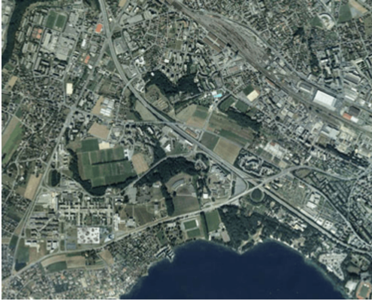
Illustration 2 : Site du campus Epfl-Unil avec le bâtiment du Learning Center.