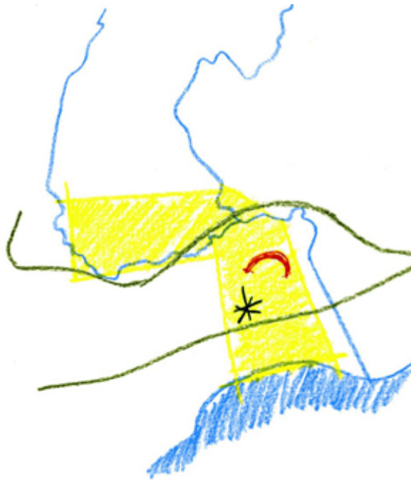
Illustration 4 : Exercice 3, hypothèses d'aménagement « Au fil du sport ».

Les étudiants sont mis ainsi en situation de pratiquer, pour la première fois, le principe du « projeter ensemble » qui caractérise la pédagogie de l'Enac. Ils doivent faire face à deux difficultés fondamentales de la conception interdisciplinaire : la construction d'un point de vue partagé et l'imagination concrète d'un futur possible. Il s'agira de développer, dans les hypothèses, une certaine vision de la vie dans le campus, en considérant qu'une intervention sectorielle doit dépendre d'une idée de l'ensemble : ici, dans la perspective d'une transformation de la signification et des prestations de l'ensemble du campus. C'est l'habitabilité du campus au sens le plus général de ce terme qui doit être mise au centre des préoccupations du groupe, dans le but de l'augmenter.