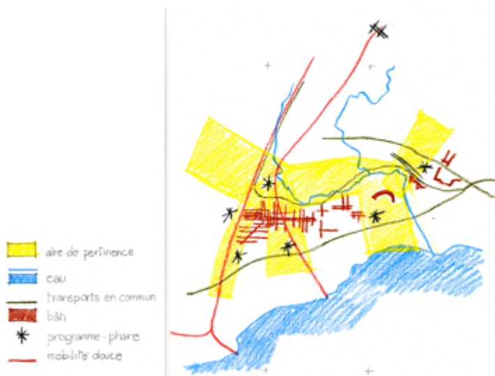
Illustration 3 : Exercice 3, croquis des cinq hypothèses d’aménagement.

– Projet. Développer les aspects prospectifs de l’hypothèse d’aménagement, au moyen d’une « esquisse » qui précise les contenus et les formes des modifications à apporter aux sites. L’ esquisse de projet n’est pas un projet à proprement parler. Si le projet représente fidèlement un état désiré (dans ses aspects matériels, dimensionnels et morphologiques) et indique précisément les moyens techniques pour le réaliser, l’esquisse développe une hypothèse en identifiant : des principes généraux de projet ; des lieux spécifiques qui devraient faire l’objet d’un investissement projectuel ponctuel (approfondi via des études de détails et des exemples) ; des stratégies qui permettraient d’orienter le futur dans le sens souhaité.