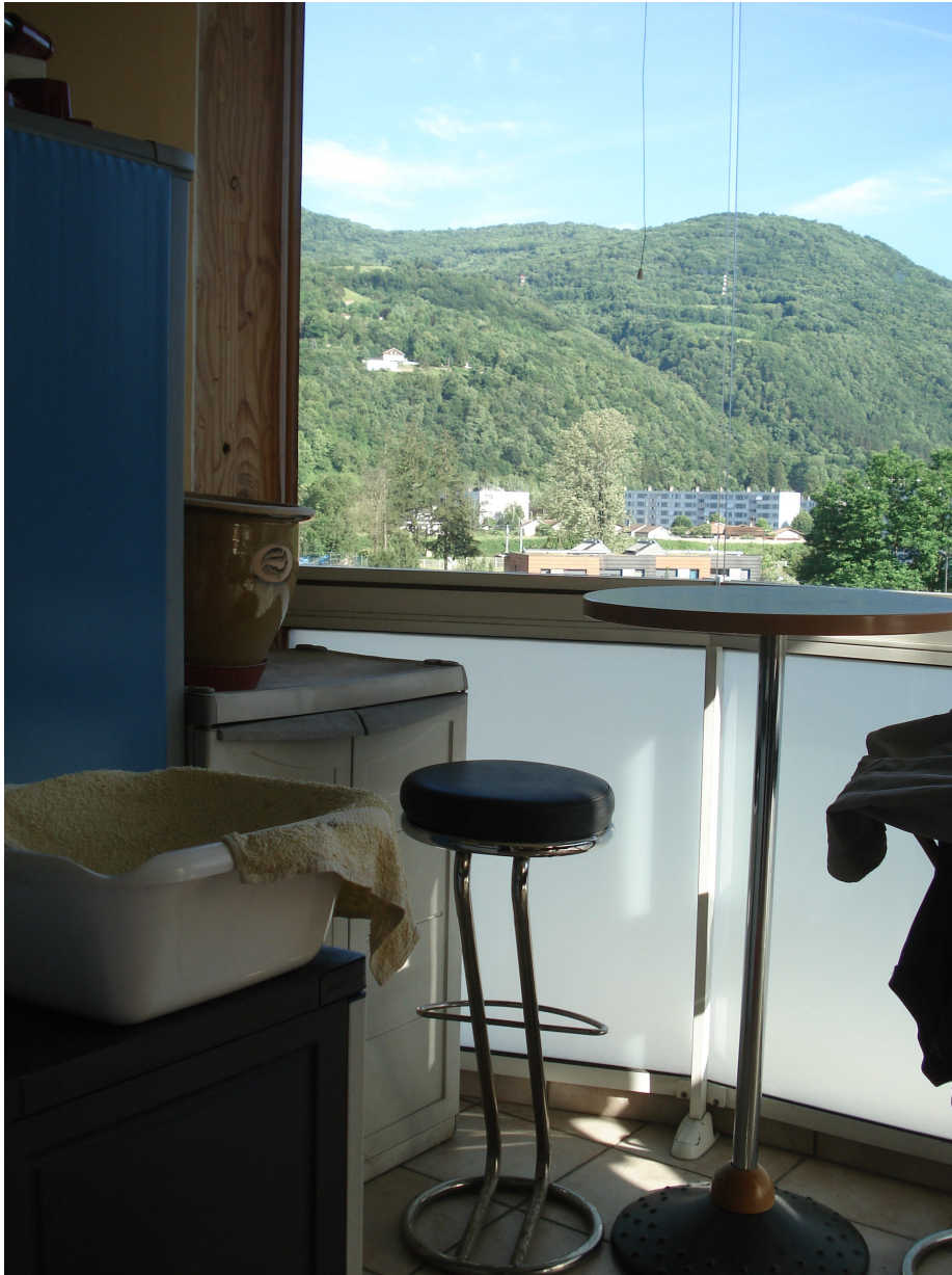
Figure 5a : Photographies prises de l'intérieur d'une serre des immeubles rénovés du quartier d'habitat social.