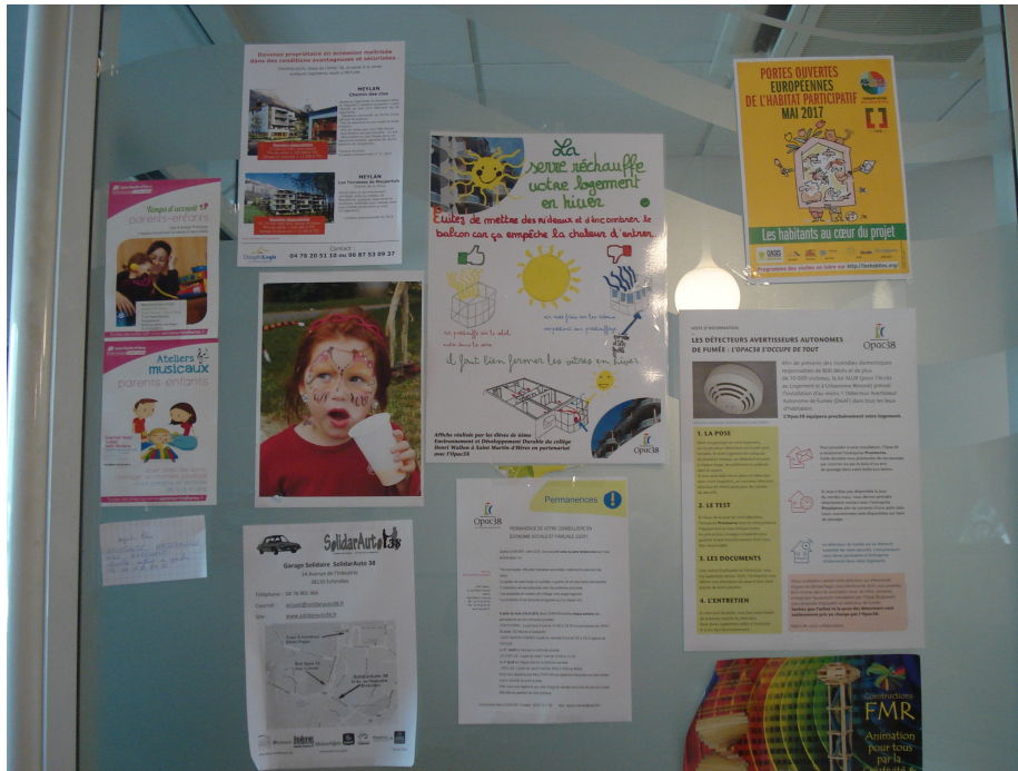
Figure 3 : Poster d'information du bon usage des balcons rénovés en serres sur le panneau d'affichage de l'agence locative du bailleur social située au cœur du quartier.

Le bailleur social, dont une des agences locatives est située en plein cœur des immeubles, peut difficilement ignorer ce processus croissant et occultant. Il avait été jugé « contre-performant » en termes d'économie d'énergie, lorsque nous avons effectué un entretien suivi d'une visite du quartier avec le chef de projet représentant la maîtrise d'ouvrage au début de l'année 2007. L'usage de rideaux avait alors été caractérisé par un manque d'informations. En dix ans, cette propension à ne pas faire ce qui a été planifié est devenue la cible de dispositifs spécifiques de communication des « bonnes pratiques ».