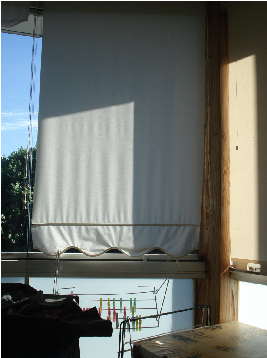
Figure 5b : Photographies prises de l'intérieur d'une serre des immeubles rénovés du quartier d'habitat social.

Dans une approche comparée de l'espace et du temps, les observations des environnements et les échanges en situation avec les habitants nous ont appris qu'il y a là un engagement actif, perceptif et pratique de l'habiter. L'espace ainsi disposé signifie plus que le seul fait de demeurer à un endroit. Il offre une vue dégagée sur les collines arborées du sud de la ville, une ouverture contemplée par les locataires sur un environnement naturel que les habitants perçoivent comme à la fois proche et lointain au quotidien, avec une place abritée des intempéries, qu'ils nous ont montrée et décrite comme accueillante, agrémentée d'un comptoir et d'un tabouret pour s'asseoir, regarder, se reposer, prendre un café, téléphoner, se manucurer les ongles, penser ou bien rêver... De l'autre côté de la serre, les rideaux sont baissés, occultant complètement la vue sur l'immeuble d'habitat social voisin, également rénové il y a dix ans. En demandant à notre hôte si nous pouvions lever le rideau pour photographier la vue sur les bâtiments, celui-ci nous a confié préférer le laisser fermé pour ne pas voir et être vu, dans cet environnement social où les habitants rencontrés se sont tous plaints de nuisances de tous ordres, de la part d'un voisinage dont ils affirment les différences culturelles ou ethniques. En cet instant, à l'ombre des rideaux de l'espace domestique de la serre et,