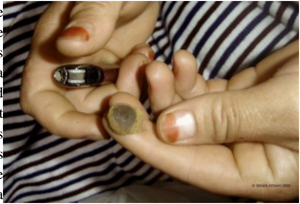
Image 3 : Mains d'une femme montrant un morceau de haschisch de qualité supérieure dans le « bled du kif ».

L'État a également participé à la création d'une identité spécifique par la tolérance historique de cette culture dans le Rif central. Les campagnes d'éradication du cannabis et de lutte contre sa propagation sur d'autres territoires du Nord (notamment dans la région de Jebala) permettent de comprendre cette dynamique. Les lançements de ces campagnes sont souvent accompagnés d'une classification que l'État opère, qui divise les territoires de culture en deux catégories : la zone historique et les nouvelles zones de culture 15 . Ces campagnes de lutte contre le cannabis, concernant en priorité les espaces nouvellement atteints par cette économie, ont permis au Rif central, et plus précisément aux Ketama et aux Ghomara (épargnés par cette politique en raison de l'enracinement de cette tradition agricole), de se forger une identité commune tout en valorisant les tolérances historiques. Par ailleurs, les Ketama et les Ghomara utilisent cette exception politique pour souligner l'authenticité et la « valeur ajoutée » du cannabis qu'ils cultivent par rapport à celui qui provient des autres territoires. Cette classification selon les zones de culture, devenue institutionnelle, cache en réalité des enjeux socio-économiques, des stratégies et des formes de résistance que les acteurs de l'espace historique de culture mobilisent pour élargir leur périmètre de culture (diffusion du savoir-faire, mobilité des acteurs, locations de terres, etc.).