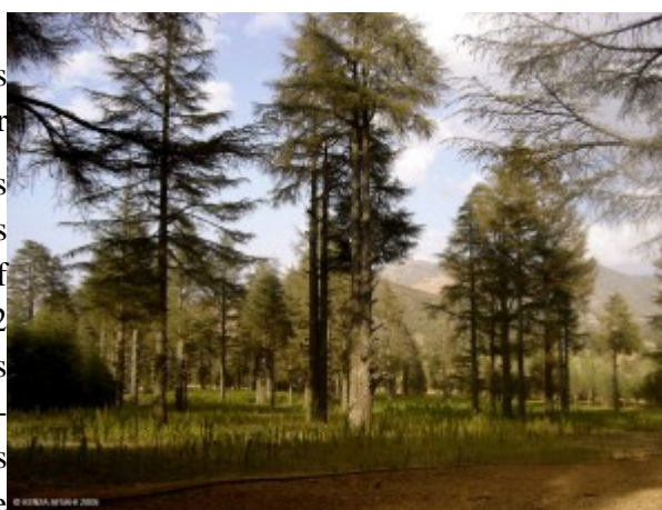
Image 1 : Champ de cannabis dans une cédraie du Rif central.

Le cannabis 1 est cultivé depuis plusieurs siècles dans le Rif central au Maroc, lequel s'étend sur environ 20 000 km 2 . C'est une des régions les plus marginalisées et les plus sous-développées du royaume. Plus des deux tiers du nord du Rif central étaient sous protectorat espagnol de 1912 à 1956, là où les massifs sont les plus montagneux et les plus boisés (cèdres, chênes-lièges, sapins, etc.) (Grovel 1996). Les premières tribus cultivatrices de Ketama et de Ghomara ne disposaient que de quelques dizaines de kilomètres carrés de culture de cannabis sur la commune de Ketama, dans la province d'Al Hoceima, et sur celle de Bab Berred, dans la province de Chefchaouen. Par la suite, et en plusieurs phases, cette surface s'est agrandie jusqu'à dépasser les frontières du Rif central et occuper plusieurs milliers d'hectares répartis sur cinq provinces de la région du Nord (Afsahi 2009).